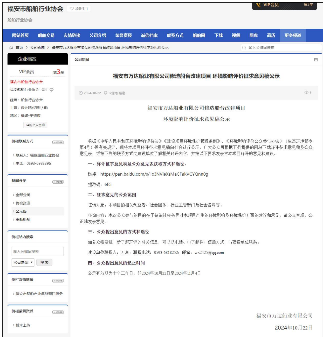
图 3-1 征求意见稿网络公示截图