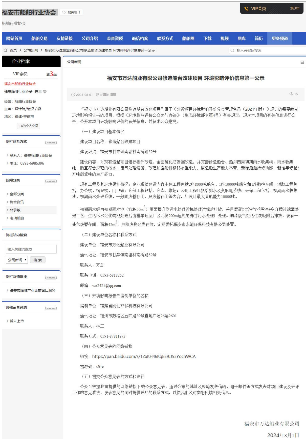
图 2-1 首次网络公示截图