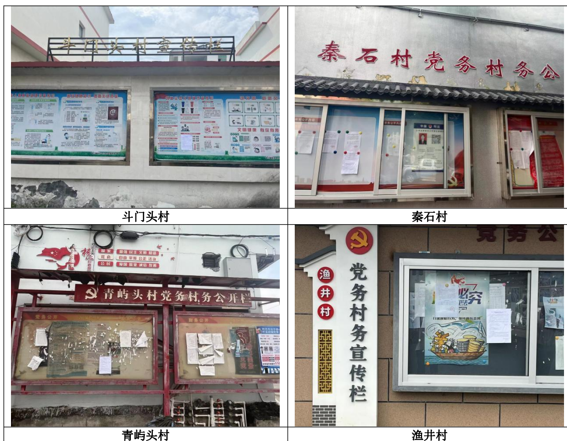
图 3.2-4 征求意见稿现场公示照片