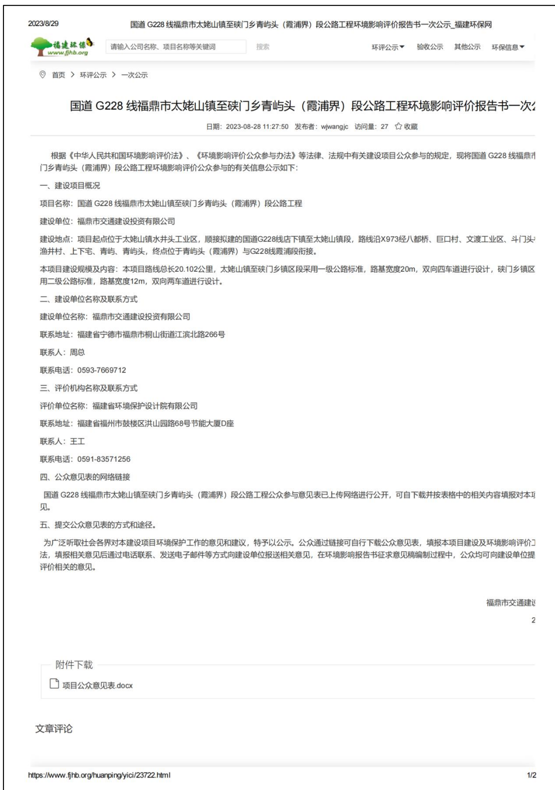
图2.2-1 首次网络公示截图